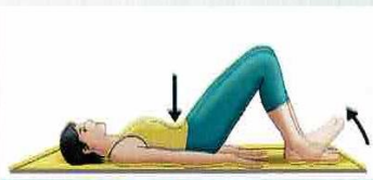
2 Grundspannung Rückenlage

Füße mit leichtem Druck gegen die Wand und Wirbelsäule gegen den Boden pressen, danach Spannung wieder abbauen