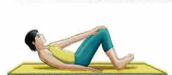
4 Grundspannung Rückenlage

Kopf- und Schulter anheben, dann Arme leicht anheben und gegen einen gedachten Widerstand drücken